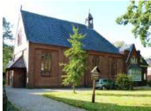
Afbeelding 2 Sint Jozefkerk - Zuidhorn

In 1844 werd de Sint Jozefkerk gebouwd in Zuidhorn. In 1929 werd de kerk gerenoveerd naar een ontwerp van A. Th. van Elmpt. Een restauratie van de kerk werd afgerond in 2008. De kerk biedt plaats aan ongeveer 100 personen. Achter de kerk ligt een grote tuin.