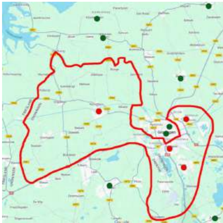
Afbeelding 1 Geografisch verzorgingsgebied Hildegardparochie

De Hildegardparochie wil een gastvrije en aandachtzame parochie zijn waar parochianen zich thuis voelen, waar vrijwilligers werken in een prettig werk-/leefklimaat, waar aandacht is voor elkaar en extra zorg voor de oudere parochiaan, die in contact staat met de samenleving, waar ruimte is voor een diverse manier van geloofsbeleving binnen de rooms-katholieke traditie en waar de continuïteit van de gemeenschap duurzaam is gewaarborgd (zie Bijlage A Pastoraal beleidsplan). De parochie staat voor belangrijke en moeilijke keuzes in een tijd waarin onze samenleving dynamische veranderingen