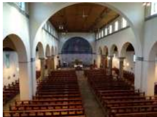
Afbeelding 5 Het interieur van de San Salvatorkerk