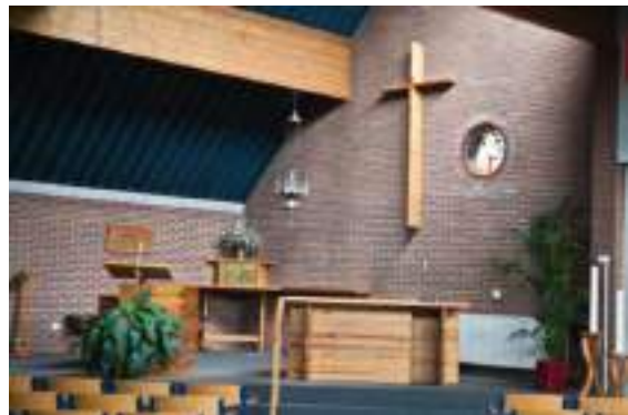
Afbeelding 9 Interieur van de Emmauskerk

De kerk herbergt een diverse collectie religieuze voorwerpen die reflecteren op zowel traditionele als hedendaagse Christelijke praktijken. Onder de belangrijkste voorwerpen bevinden zich verschillende kelken en cibories. Deze voorwerpen, vaak vervaardigd uit gebakken en geglazuurd aardewerk, dragen artistieke reliëfbeeldingen van christelijke symbolen zoals vissen en broodmanden, wat hun sacrale functie benadrukt. Daarnaast bevinden zich in de kerk verschillende schalen die gebruikt worden tijdens de liturgie, versierd met vergelijkbare motieven en uitgevoerd in dezelfde materialen. Een ander opmerkelijk item is een ampullenstel, gebruikt voor het bewaren van gewijde olie, dat eveneens uitblinkt in decoratieve en functionele pracht. De collectie bevat ook meerdere kandelaars en processiekruisen. Deze zijn typisch vervaardigd uit smeedijzer en hout, materialen die zowel duurzaamheid als schoonheid bieden. De liturgische kledij zoals stola's en kazuifels, veelal geproduceerd door bekende ateliers zoals die van Slabbinck, tonen een verscheidenheid aan kleuren en stoffen, elk afgestemd op de liturgische kalender. Verder versterken objecten zoals een wierookvat en bijbehorende wierookscheepjes, beide uitgevoerd in gepolijst messing met fijne decoratieve details.