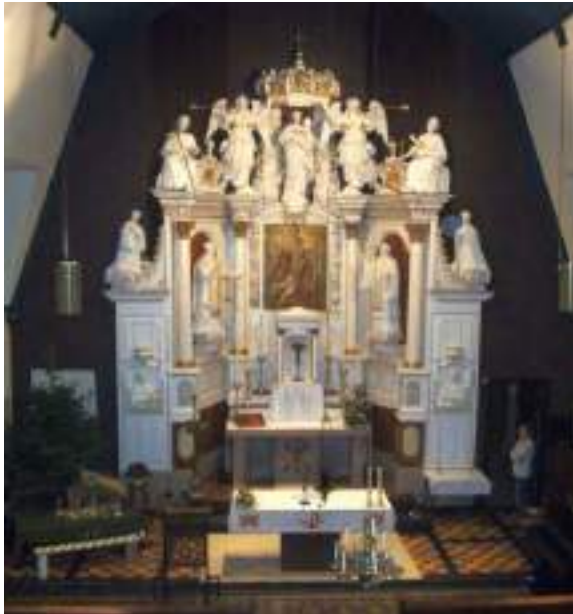
Afbeelding 3 Altaar van de Sint Jozefkerk

Het houtsnijwerk-altaar komt uit een Jezuïetenstatie aan het Hoge der Aa in de stad Groningen (1670). Het eikenhouten beeld dat in de kerk links van het altaar hangt, Onze Lieve Vrouw van Aduard, stamt uit 1500. De kerk beschikt over een opmerkelijke verzameling liturgische objecten, die getuigen van een rijke geschiedenis en een diepgaande spirituele traditie. Deze collectie omvat onder andere diverse objecten zoals cibories, monstransen en kandelaars. In het hart van de collectie bevinden zich zilveren cibories die dateren uit het begin van de 20e eeuw, waarvan een aantal prachtig gegraveerd zijn met religieuze motieven zoals druiventrossen en korenaren, symbolen van de Eucharistie. De kerk herbergt ook unieke monstransen die zorgvuldig zijn vervaardigd met