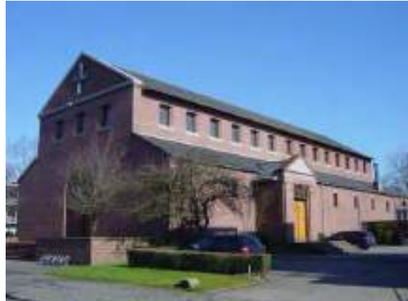
Afbeelding 4 San Salvatorkerk - Groningen

Een meerjaren onderhoudsplan is opgesteld voor de periode 2024-2033, waarbij prioriteit wordt gegeven aan herstelwerkzaamheden die de integriteit van de kerk op lange termijn waarborgen,