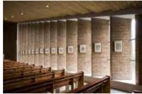
Afbeelding 7 Interieur H. Nicolaaskerk

Bij de Nicolaaskerk in Haren is een aardbevinginspectie geweest. De aangetroffen scheuren zijn veelal afgedaan als constructiefouten. Van enkele scheuren die nauwelijks van betekenis zijn kon men geen aanwijsbare oorzaak aangeven, wat afgehandeld is met een kleine schadevergoeding.