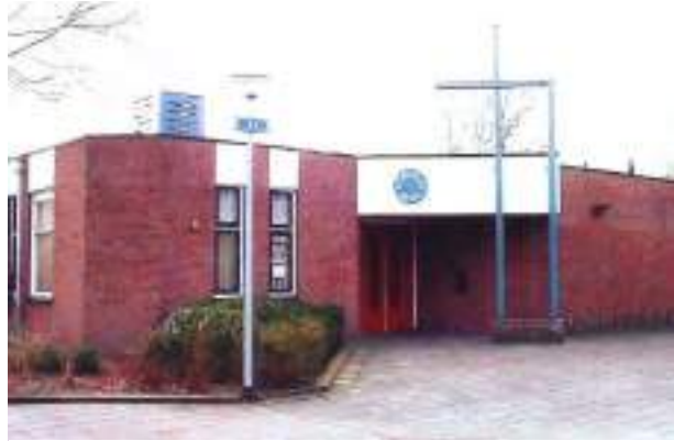
Afbeelding 8 Emmauskerk - Groningen

De Walfriedgemeenschap is een multiculturele, open geloofsgemeenschap. De parochianen zijn oorspronkelijk afkomstig uit veel verschillende delen van de wereld. Er is een nauwe band met de Sint Antoniusparochie in Lelydorp, Suriname. Ook Roma en andere woonwagenbewoners zijn bij de gemeenschap aangesloten.