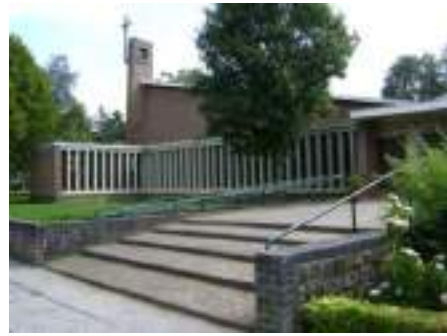
Afbeelding 6 H. Nicolaaskerk - Haren

De H. Nicolaaskerk werd in 1958-59 gebouwd in Haren naar ontwerp van J.A.A. Dresmé, tegenover de enkele jaren eerder gebouwde katholieke St. Nicolaasschool. De architectuur valt onder de Wederopbouwstijl, die in Nederland van 1940-1965 populair was. In 2022 werd in de kerk een Mariakapel gecreëerd. De kerk biedt plaats aan 360 personen, waarvan 320 personen in de banken en 40 op stoelen.